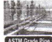
ASTM Grade Pipe