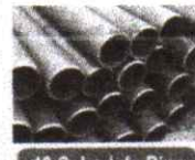
40 Schedule Pipe